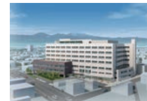
新病院イメージ図

私たちは、地域住民の総合病院として保健・医療・福祉活動を介して、地域社会の発展に貢献します。