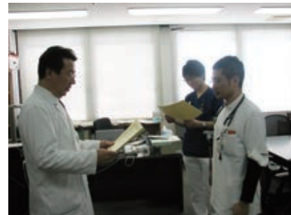
臨床研修修了証授与