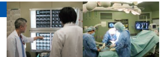
指導医のレクチャー