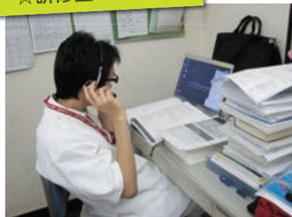
アメリカ人講師による医療英会話レッスン